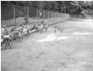
▲ 鹿園（ろくえん）と鹿

森の参道を進むと、左手に鹿園（ろくえん）があり、数多くの鹿が飼育されている。鹿島神宮のお使いは鹿なのだ。