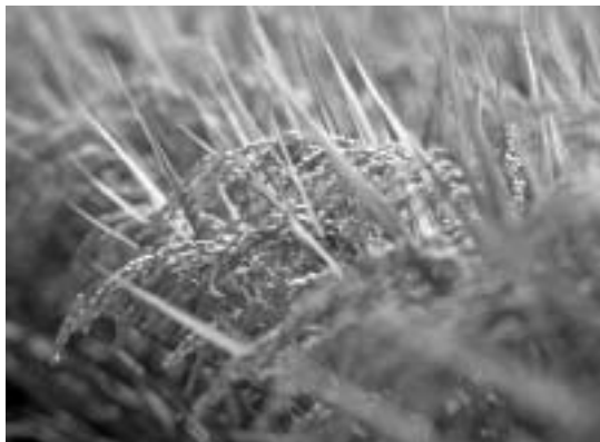
実るほど頭を垂れる 稲穂かな