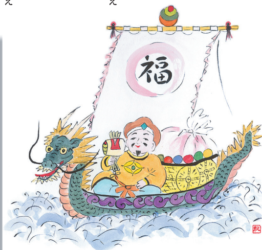
「福船」 紀雀 作(遊画の会)