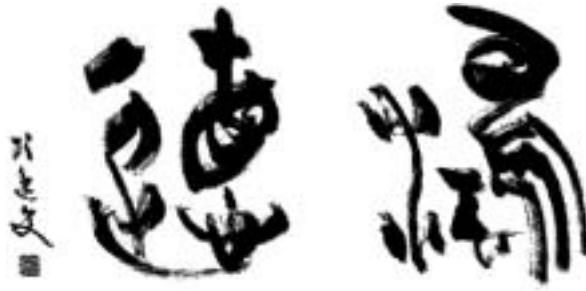
題 字 青 山 杉 雨 先 生