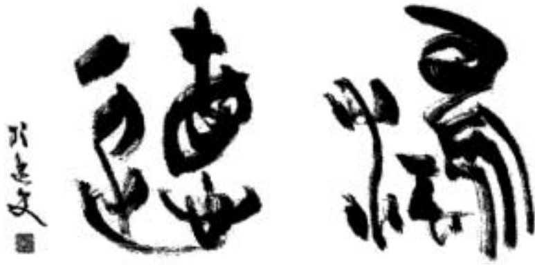
題字 青山杉雨先生